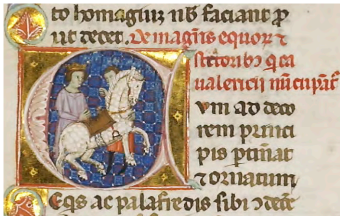
Abb. VIII: Leges Palatinae, Brüssel, Bibliothèque royale de Belgique, MS 9169, erster Teil, fol. 15r (Ausschnitt)