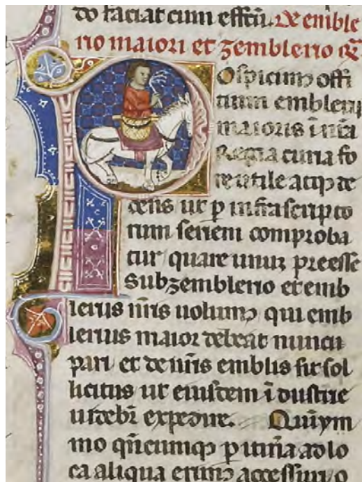
Abb. XI: Leges Palatinae, Brüssel, Bibliothèque royale de Belgique, MS 9169, erster Teil, fol. 19r (Ausschnitt)