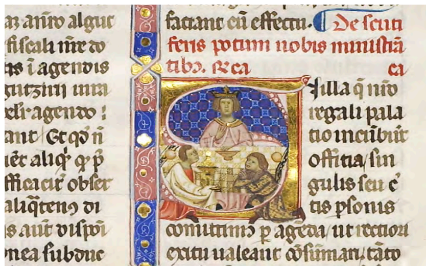
Abb. III: Leges Palatinae, Brüssel, Bibliothèque royale de Belgique, MS 9169, erster Teil, fol. 6r (Ausschnitt)