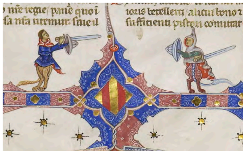
Abb. IV: Leges Palatinae, Brüssel, Bibliothèque royale de Belgique, MS 9169, erster Teil, fol. 8v (Ausschnitt)