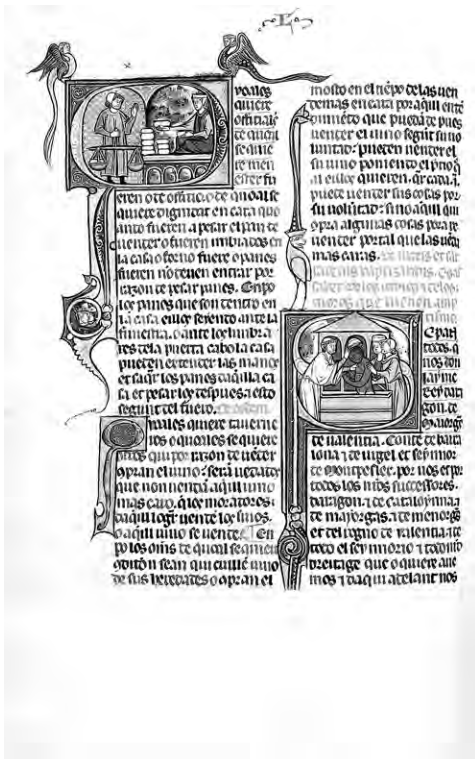
Abb. 4: Vidal mayor, Pamplona um 1300 (Los Angeles, Getty Collection, Ms. Ludwig XIV 6, f. 242v: Buch VIII.8): Über die Beaufsichtigung des Brotgewichts