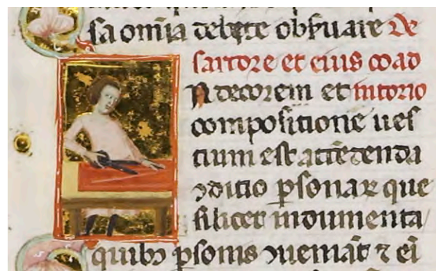
Abb. XVI: Leges Palatinae, Brüssel, Bibliothèque royale de Belgique, MS 9169, zweiter Teil, fol. 30v (Ausschnitt)