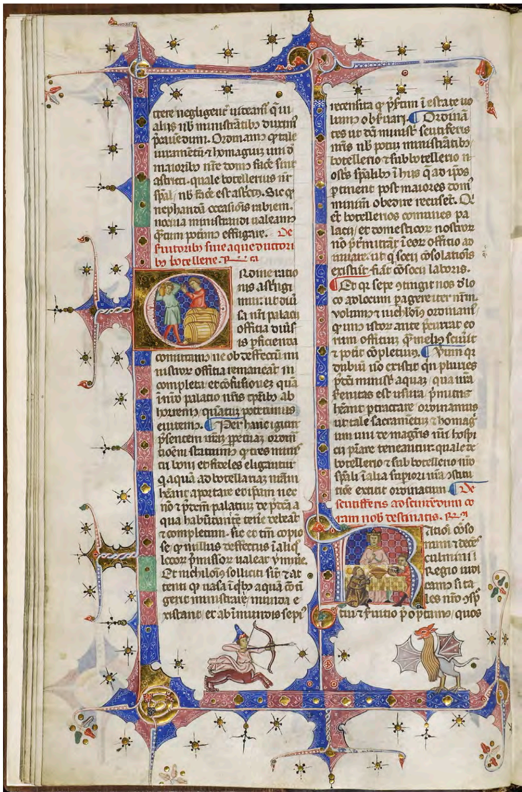
Abb. V: Leges Palatinae, Brüssel, Bibliothèque royale de Belgique, MS 9169, erster Teil, fol. 9v