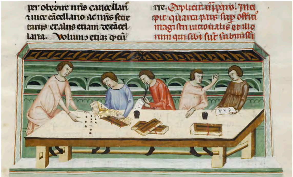
Abb. XXIII: Leges Palatinae, Brüssel, Bibliothèque royale de Belgique, MS 9169, vierter Teil, fol. 46r (Ausschnitt)