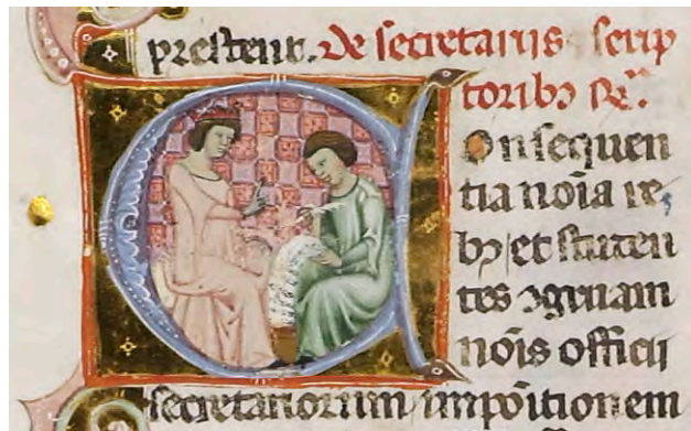
Abb. XV: Leges Palatinae, Brüssel, Bibliothèque royale de Belgique, MS 9169, zweiter Teil, fol. 26v (Ausschnitt)