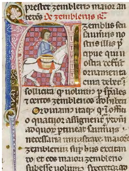
Abb. XII: Leges Palatinae, Brüssel, Bibliothèque royale de Belgique, MS 9169, erster Teil, fol. 19v (Ausschnitt)