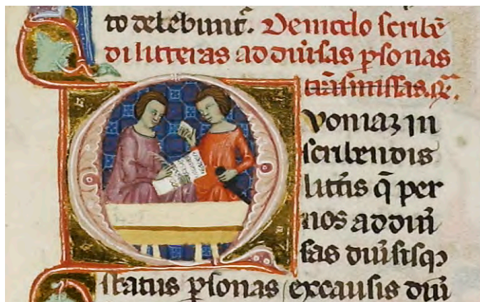
Abb. XXVII: Leges Palatinae, Brüssel, Bibliothèque royale de Belgique, MS 9169, siebter Teil, fol. 60r (Ausschnitt)