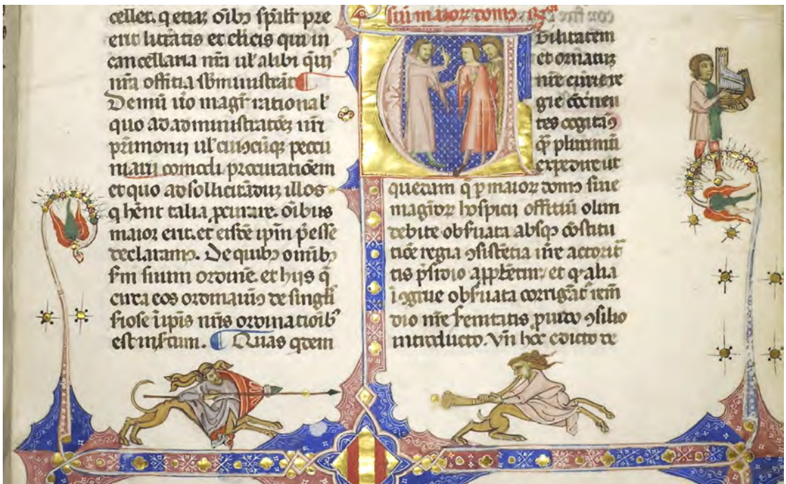
Abb. II: Leges Palatinae, Brüssel, Bibliothèque royale de Belgique, MS 9169, erster Teil, fol. 2r (Ausschnitt)