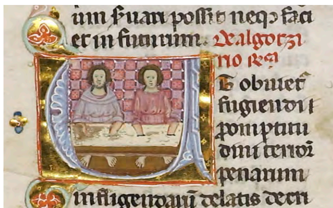
Abb. X: Leges Palatinae, Brüssel, Bibliothèque royale de Belgique, MS 9169, erster Teil, fol. 18v (Ausschnitt)