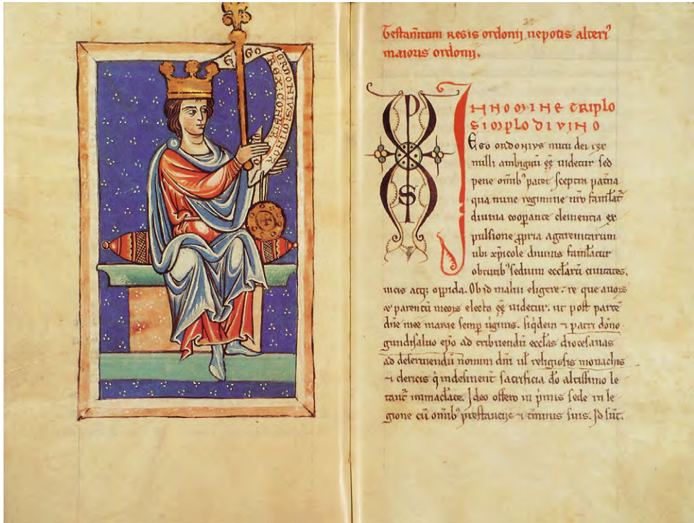
Abb. 9: Libro de las Estampas, um 1200 (León, Archivo de la Catedral, Cod. 25, f. 12v–13r): Schenkungsurkunde König Ordoños III.

nig Ordoños II. (914–924) 49 folgt auf fol. 12v der jugendliche Ordoño III. (951–956) (Abb. 9). Sein Körper, sein Blick und seine Hände, in denen er das Zepter hält, weisen zum Text hinüber, sein Spruchband zitiert den Urkundenbeginn: Ego Ordonius minor rex . Das Bild authentifiziert die Urkundenabschrift, so wie dies für eine Originalurkunde im 12. Jahrhundert die anhängende Bulle mit dem Herrscherbildnis leistet; sie ist besonders groß, aber vereinfacht wiedergegeben. 50 Die Bilder der nachfolgenden Könige sind in Haltung, Kleidung und Alter jeweils variiert. 51