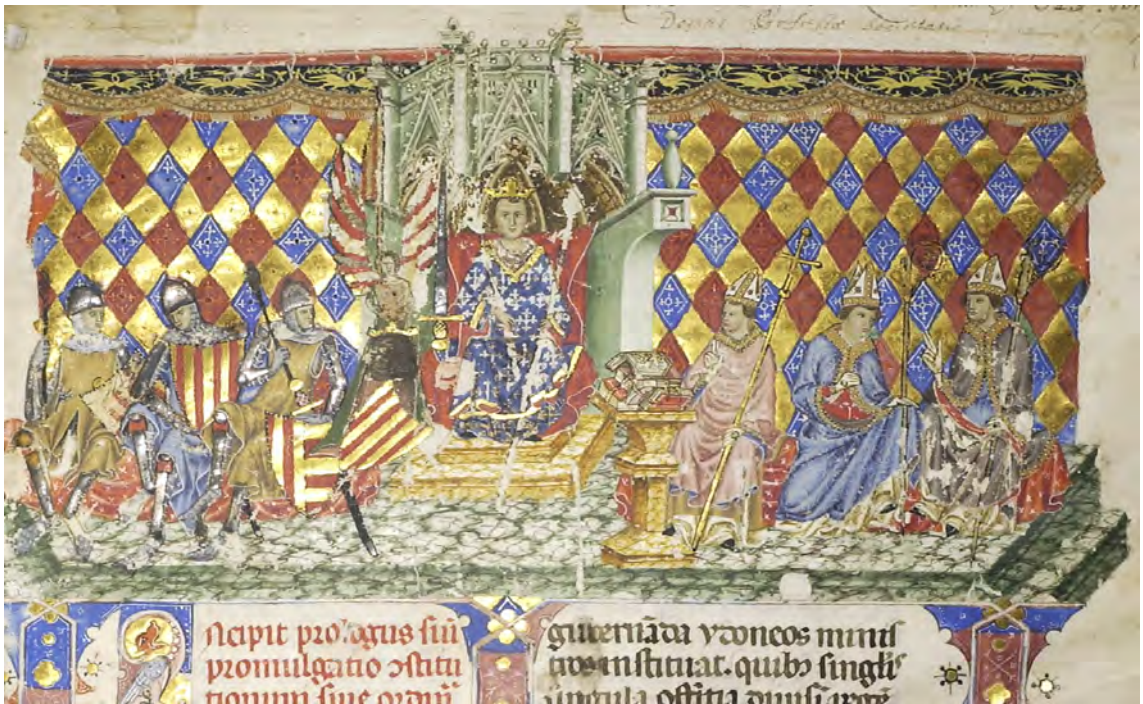
Abb. I: Leges Palatinae, Brüssel, Bibliothèque royale de Belgique, MS 9169, erster Teil, fol. 1r (Ausschnitt)