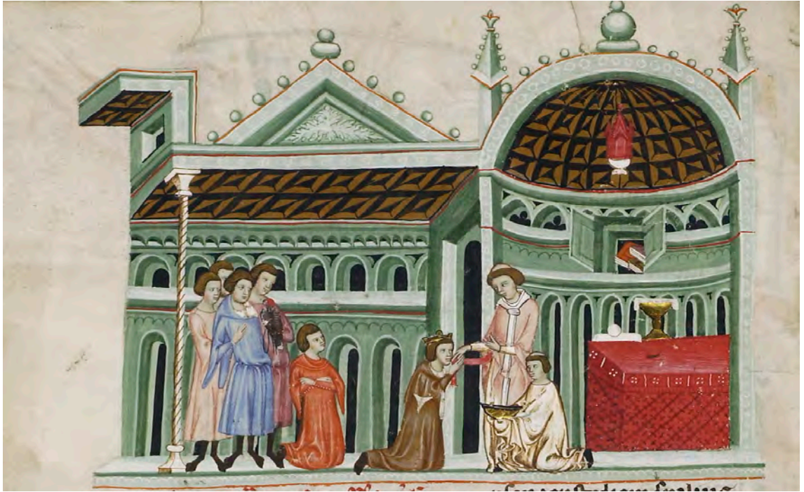
Abb. XIII: Leges Palatinae, Brüssel, Bibliothèque royale de Belgique, MS 9169, zweiter Teil, fol. 20v (Ausschnitt)