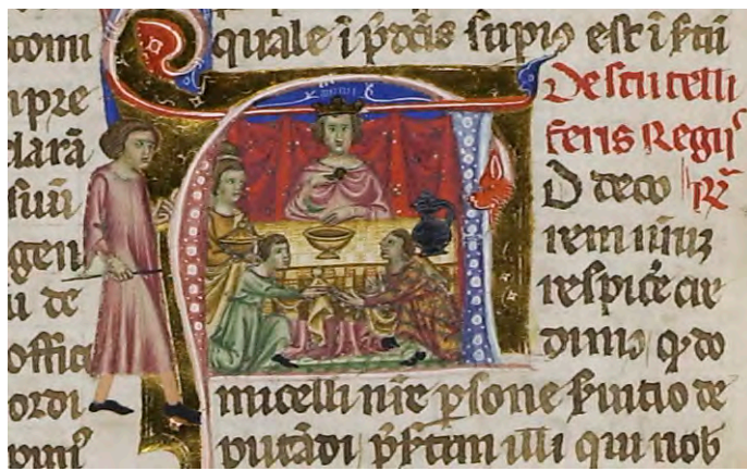
Abb. VIa: Leges Palatinae, Brüssel, Bibliothèque royale de Belgique, MS 9169, erster Teil, fol. 10v (Ausschnitt)