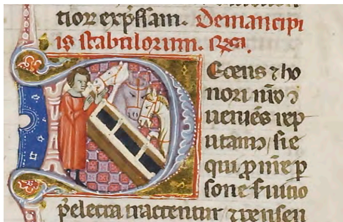
Abb. IX: Leges Palatinae, Brüssel, Bibliothèque royale de Belgique, MS 9169, erster Teil, fol. 16v (Ausschnitt)