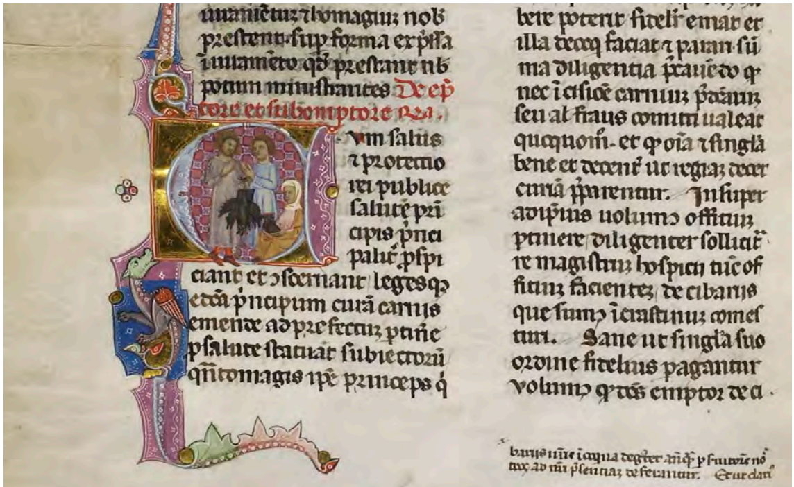
Abb. VIIa: Leges Palatinae, Brüssel, Bibliothèque royale de Belgique, MS 9169, erster Teil, fol. 11v (Ausschnitt)