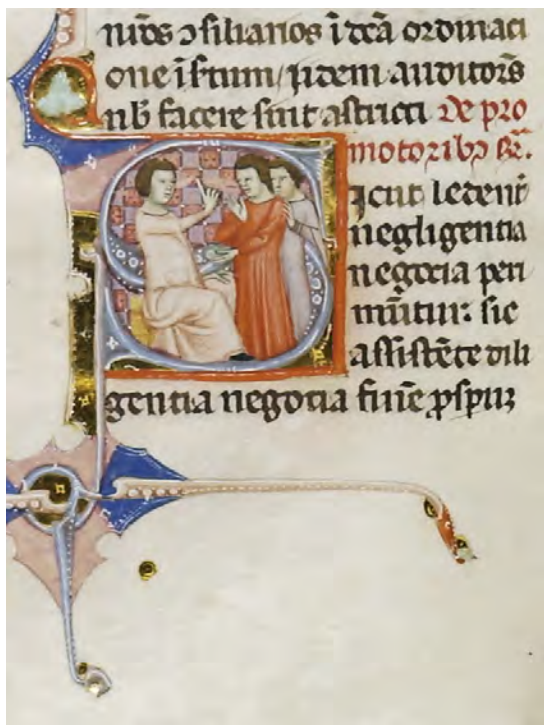
Abb. XX: Leges Palatinae, Brüssel, Bibliothèque royale de Belgique, MS 9169, dritter Teil, fol. 40v (Ausschnitt)