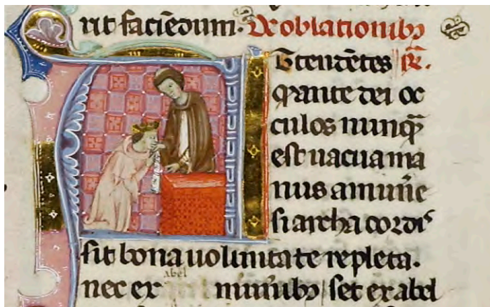
Abb. XXIV: Leges Palatinae, Brüssel, Bibliothèque royale de Belgique, MS 9169, sechster Teil, fol. 54r (Ausschnitt)