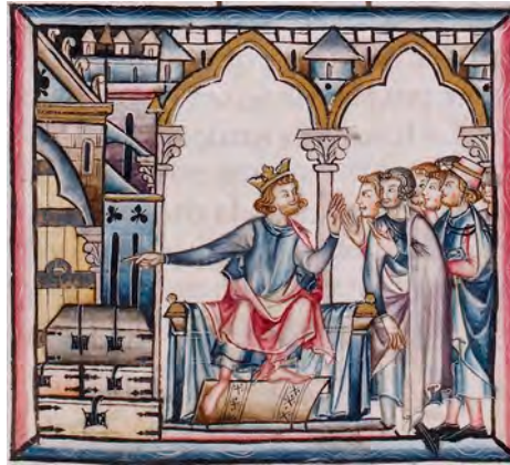
Abb. 3: Libro de las Leyes/Primera Partida (London, British Library, Add. Ms. 20787, f. 86v): 14. Titulus De las cosas de la elesia que no se deven enagenar

(Los Angeles, Getty Collection, Ms. Ludwig XIV 6). 29 Dies geschieht vermutlich im Auftrag König Jakobs II. von Aragon (1291–1327). Die neun Bücher verhandeln das kirchliche Recht, Zivil- und Strafrecht 30 , sie sind mit insgesamt über 150 historisierten Initialen geziert. Deutlich ist die Auseinandersetzung mit dem römischen Recht sowie der umfassende, systematisierende und damit ‚moderne‘ Charakter dieser Rechtsord-