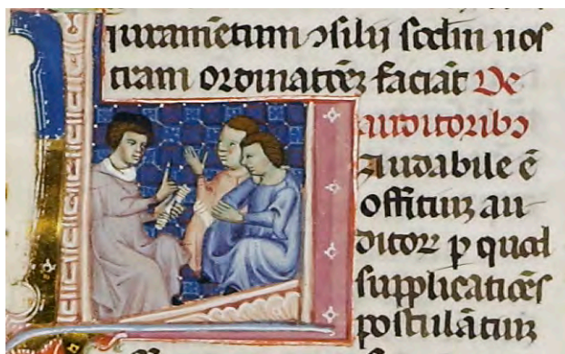
Abb. XIX: Leges Palatinae, Brüssel, Bibliothèque royale de Belgique, MS 9169, dritter Teil, fol. 39r (Ausschnitt)