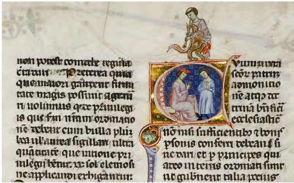
Abb. XXVIII: Leges Palatinae, Brüssel, Bibliothèque royale de Belgique, MS 9169, siebter Teil, fol. 67r (Ausschnitt)