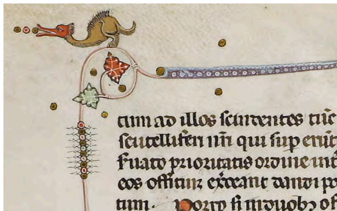
Abb. VIIb: Leges Palatinae, Brüssel, Bibliothèque royale de Belgique, MS 9169, erster Teil, fol. 11v (Ausschnitt)