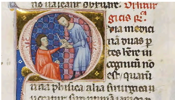
Abb. XIV: Leges Palatinae, Brüssel, Bibliothèque royale de Belgique, MS 9169, zweiter Teil, fol. 26r (Ausschnitt)