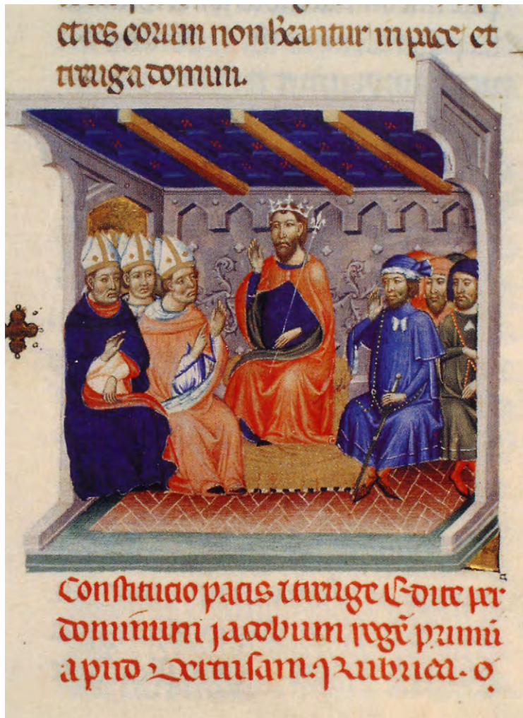
Abb. 6: Primer Llibre verd de Barcelona, um 1333 (Barcelona, Arxiu Històric de la Ciutat, f. 75): Constitucio pacis et treuge edita per dominum iacobum regem primum (Landfrieden Jakobs I.)

Sie stehen damit innerhalb einer besonderen spanischen Tradition illuminierten, königlicher Privilegienbücher. 39 Anders als ihre schlichten, für den Gebrauch in Verwaltung