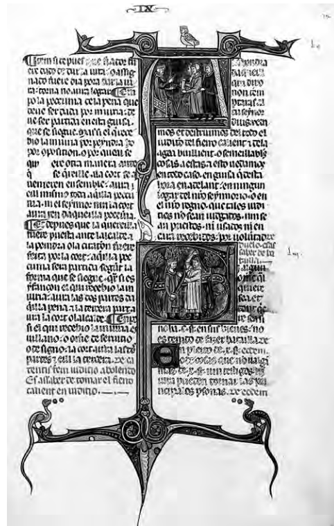
Abb. 5: Vidal mayor, Pamplona um 1300 (Los Angeles, Getty Collection, Ms. Ludwig XIV 6, f. 276r: Buch IX.60): Bordüre mit kugelspeienden Drachen

Doch nachdem sie im Laufe des 13. Jahrhunderts in Rechtsstreitigkeiten sowie durch die Kommentierung des Domkanonikers Pere Albert (†1261) zu einem Kerntext katalanischen Rechts avancierten, wurden seit den 1320er Jahren auch illuminierte Pracht Ausgaben der ‚Usatges‘ als Bestandteil größerer Sammlungen katalonischen Rechts angefertigt. 35 In der ältesten illuminierten Handschrift (Bibliothèque Nationale, Paris, lat. 4670A, verfasst um 1321–23), die stilistisch noch vornehmlich an der französischen Buchmalerei orientiert ist, folgen auf die ‚Usatges de Barcelona‘ die ‚Constitutions‘ von Alfons I. und Jakob I., dann die ‚Commemoracions‘ Pere Alberts, ein Traktat de