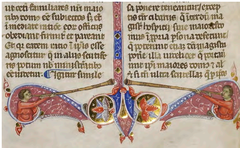
Abb. VIb: Leges Palatinae, Brüssel, Bibliothèque royale de Belgique, MS 9169, erster Teil, fol. 10v (Ausschnitt)