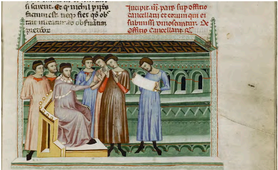
Abb. XVII: Leges Palatinae, Brüssel, Bibliothèque royale de Belgique, MS 9169, zweiter Teil, fol. 35r (Ausschnitt)