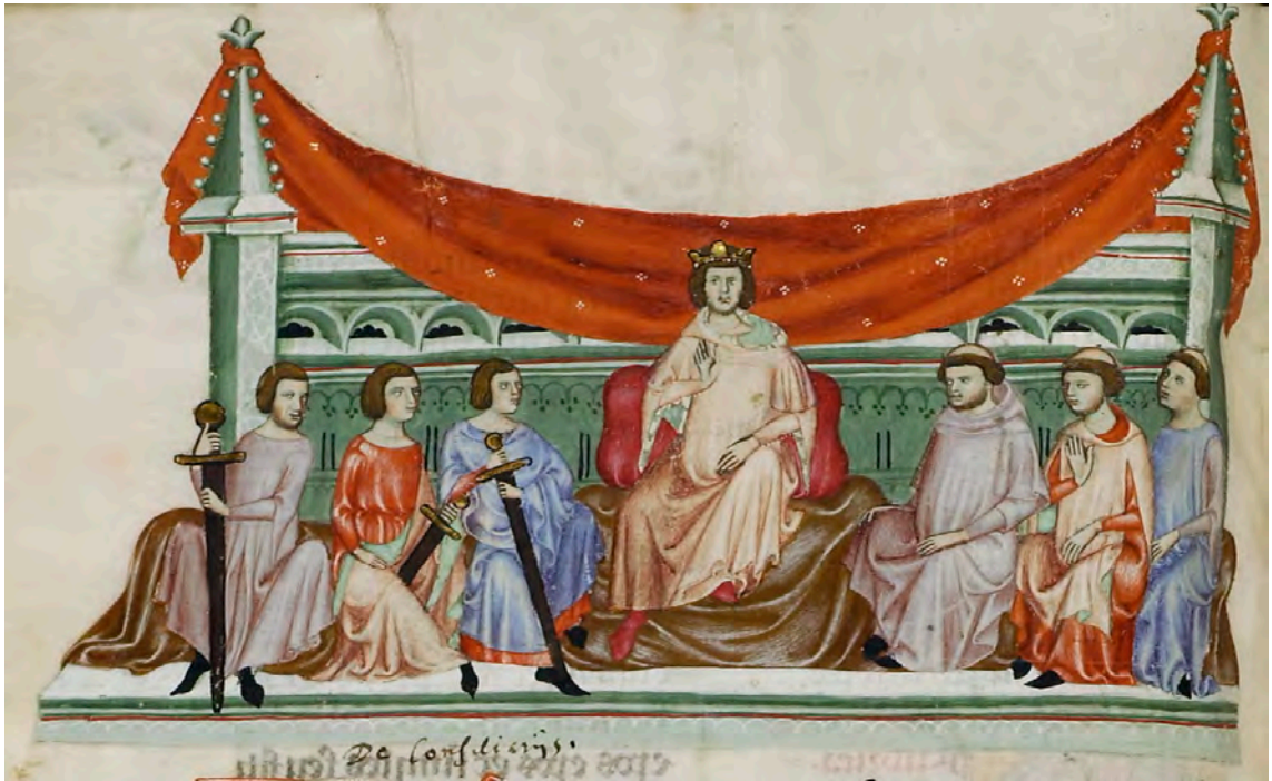
Abb. XXVI: Leges Palatinae, Brüssel, Bibliothèque royale de Belgique, MS 9169, siebter Teil, fol. 56v (Ausschnitt)