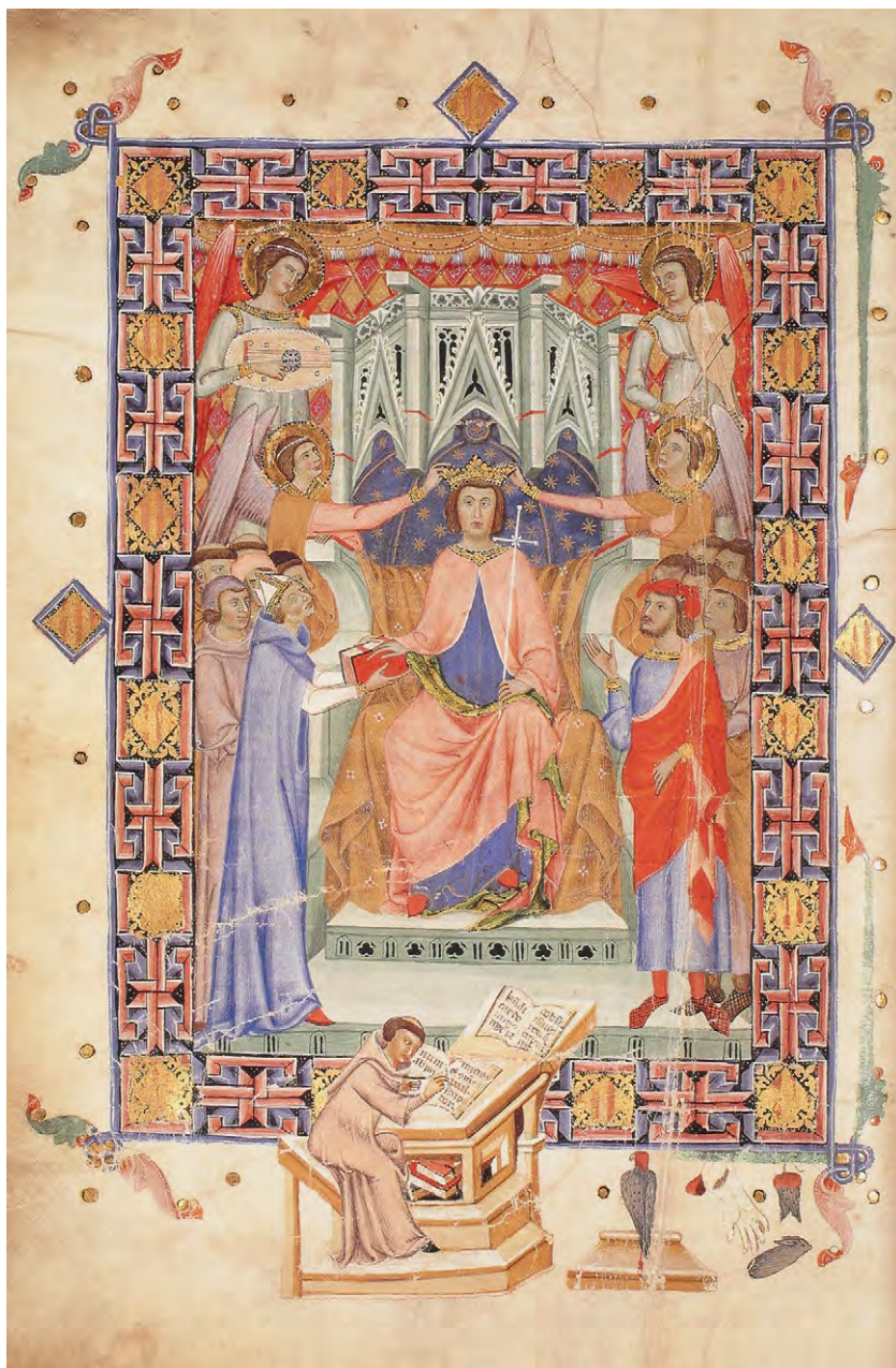
Abb. 7: Llibre de privilegis, 1334–37 (Palma de Mallorca, Archivo del reino, f. 1r): Frontispiz mit Jakob I. von Aragon und Schreiber Romeu des Poal