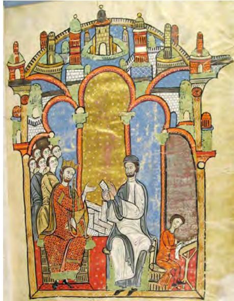
Abb. 10: Liber feudorum maior, vor 1196 (Archivo de la Corona de Aragon, Barcelona, Ms. Real Can. Reg. 1): Frontispiz

In Größe und Umfang werden diese Privilegienbücher überragt durch den ‚Liber feudorum maior‘ (Archivo de la Corona de Aragon, Barcelona, Ms. Real Can. Reg. 1), den der Diakon der Kathedrale von Barcelona, Ramón de Caldes (1161–1199), im Auftrag von König Alfons II. von Aragon (1162–1196) zusammengestellt hat. 52 Der König beauftragte ihn mit der Suche und Durchsicht von Urkunden, um sich seiner königlichen Rechts- und Lehnsansprüche in seinen disparaten Herrschaftsgebieten zu vergewissern und um sie gegenüber dem Adel deutlich zu machen und durchzusetzen. 53 Die Handschrift umfasste, wie aus einem Register des 14. Jahrhunderts hervorgeht, ursprünglich rund 900 Dokumentabschriften, die bis ins 10. Jahrhundert zurückreichen, zusammengestellt auf 888 Folios in zwei Bänden bei einer Blattgröße von 51x35 cm. 54 Erhalten sind 89 Folios mit 183 darauf eingetragenen Dokumenten, dazu kommen noch 26 Miniaturseiten. Eröffnet wird der Codex durch ein Autoren- und Dedikationsbild vor goldenem, silbernem und blauem Grund unter Hufeisenbogen-Arkaden (Abb. 10).