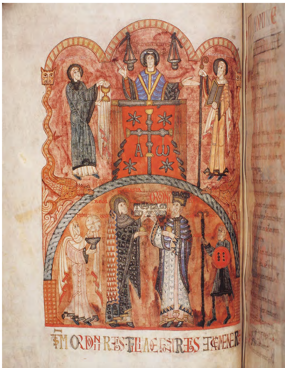
Abb. 8: Libro de los testamentos, um 1120 (Oviedo, Archiv der Kathedrale, Ms.1, f. 26v): Schenkung Königin Urracas und Ordoños III. (951–956)