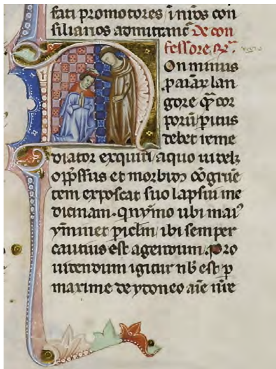
Abb. XXI: Leges Palatinae, Brüssel, Bibliothèque royale de Belgique, MS 9169, dritter Teil, fol. 41r (Ausschnitt)