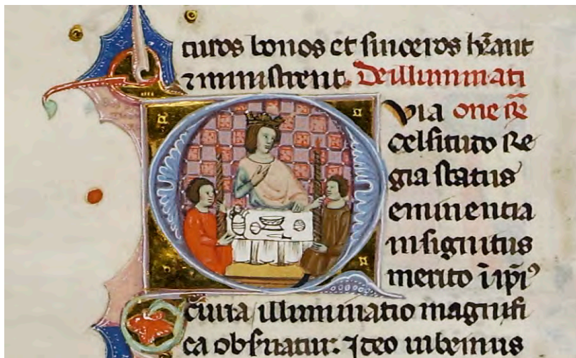
Abb. XXV: Leges Palatinae, Brüssel, Bibliothèque royale de Belgique, MS 9169, sechster Teil, fol. 55v (Ausschnitt)