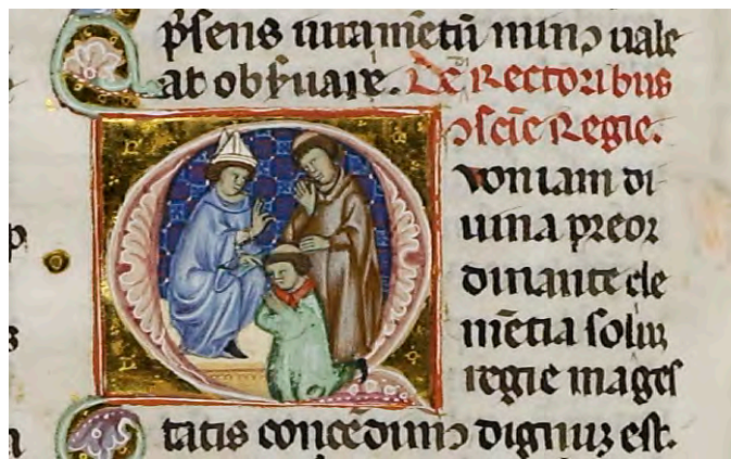
Abb. XVIII: Leges Palatinae, Brüssel, Bibliothèque royale de Belgique, MS 9169, dritter Teil, fol. 38v (Ausschnitt)