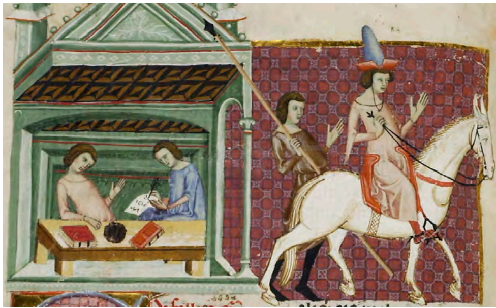
Abb. XXIX: Leges Palatinae, Brüssel, Bibliothèque royale de Belgique, SMS 9169, achter Teil, fol. 78v (Ausschnitt)